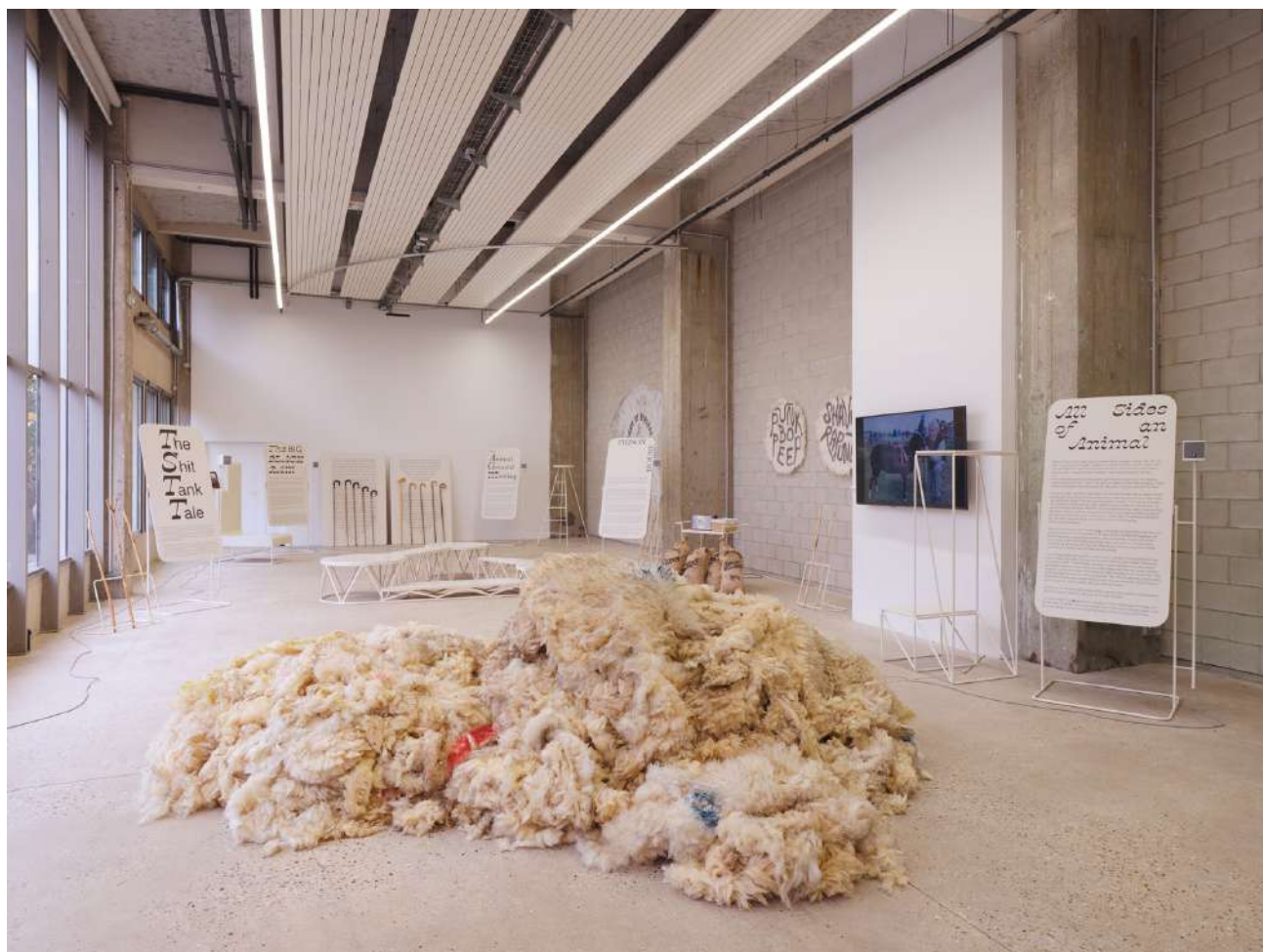
Vue de l'exposition « Cœur de Bergère » Orla Barry, Bétonsalon – centre d'art et de recherche, Paris, 2025. © Orla Barry / ADAGP, Paris 2025.