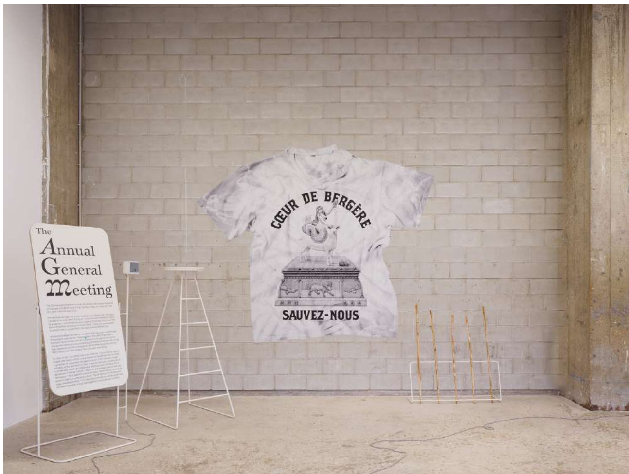
The Anthropologist's T-shirt and The Shepherd's Warning, 2022, impression sur papier. Vue de l'exposition « Cœur de Bergère » Orla Barry, Bétonsalon – centre d'art et de recherche, Paris, 2025. © Orla Barry / ADAGP, Paris 2025.