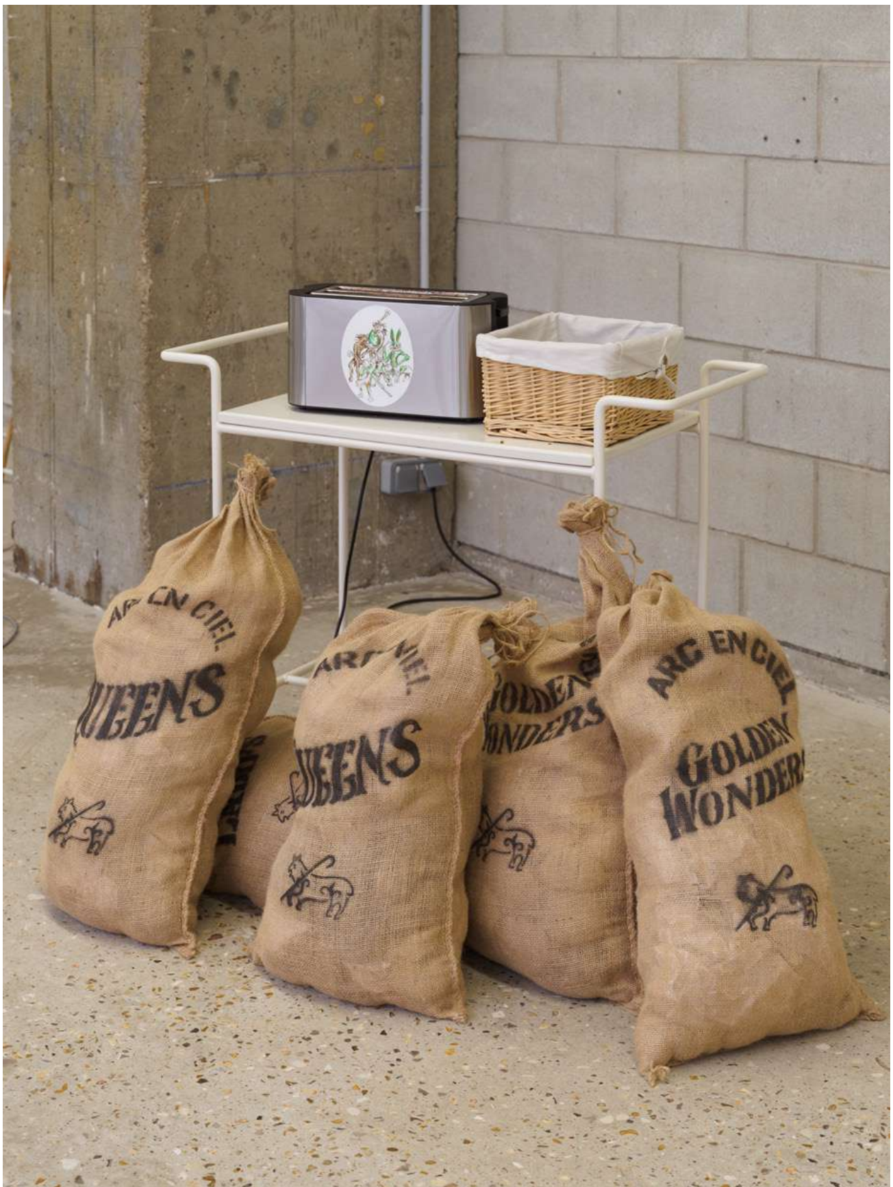
Spin Spin Scheherazade, 2019, installation sonore / performance, 65', matériaux divers, structures métalliques laquées, panneaux composites laqués, panneaux multiplex stratifiés, texte, forme en polyester, photographie encadrée, grille-pain, panier, sacs en jute imprimés, tabourets. Vue de l'exposition « Cœur de Bergère » Orla Barry, Bétonsalon – centre d'art et de recherche, Paris, 2025. © Orla Barry / ADAGP, Paris 2025.