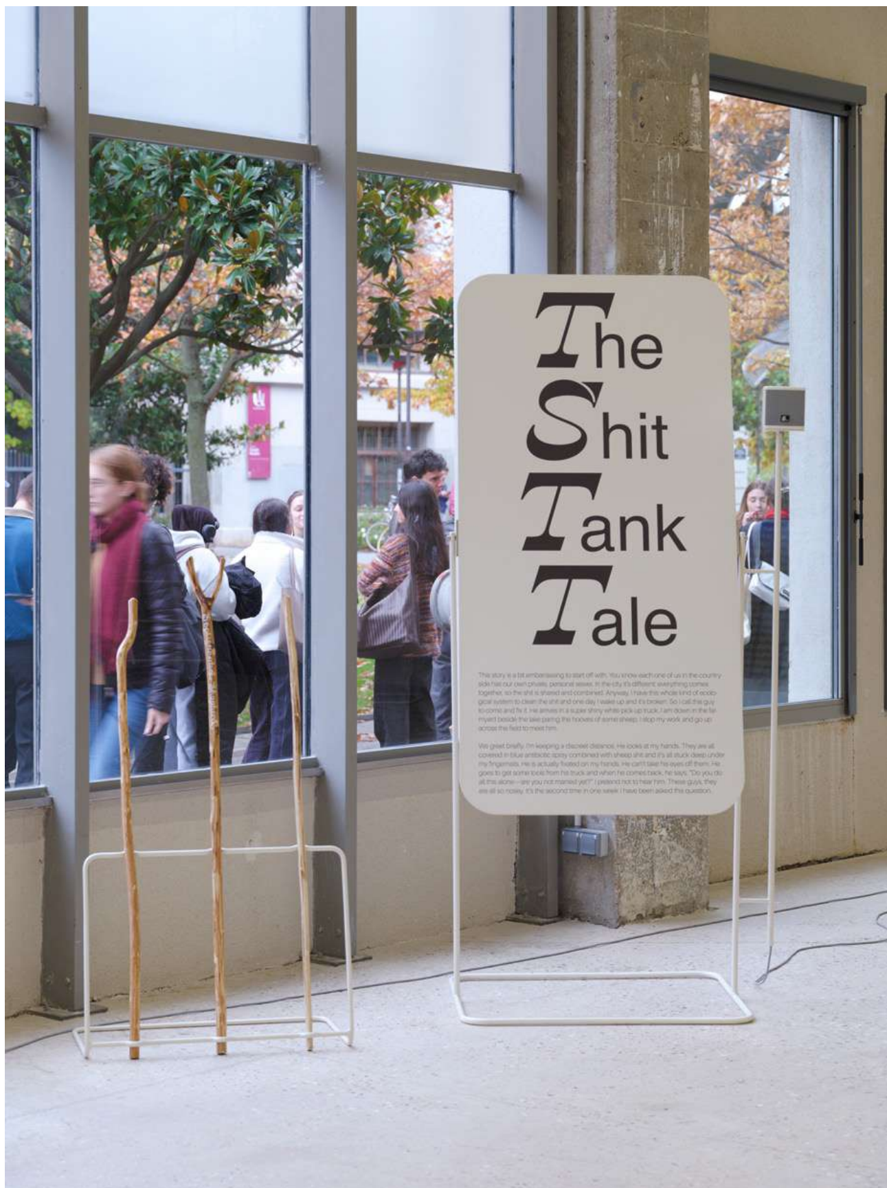
Shaved Rapunzel's Shepherds (performance version), 2025, Bâtons en bois peints à la main. Vue de l'exposition « Cœur de Bergère » Orla Barry, Bétonsalon - centre d'art et de recherche, Paris, 2025. © Orla Barry / ADAGP, Paris 2025.