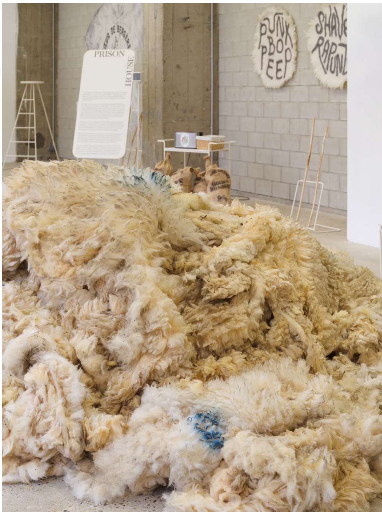
Stockpile , 2025, laine brute de Lleyn provenant du troupeau de moutons d'Orla Barry, tonte de l'année.

Vue de l'exposition « Cœur de Bergère » Orla Barry, Bétonsalon – centre d'art et de recherche, Paris, 2025. © Orla Barry / ADAGP, Paris 2025. Photo : Aurélien Mole.