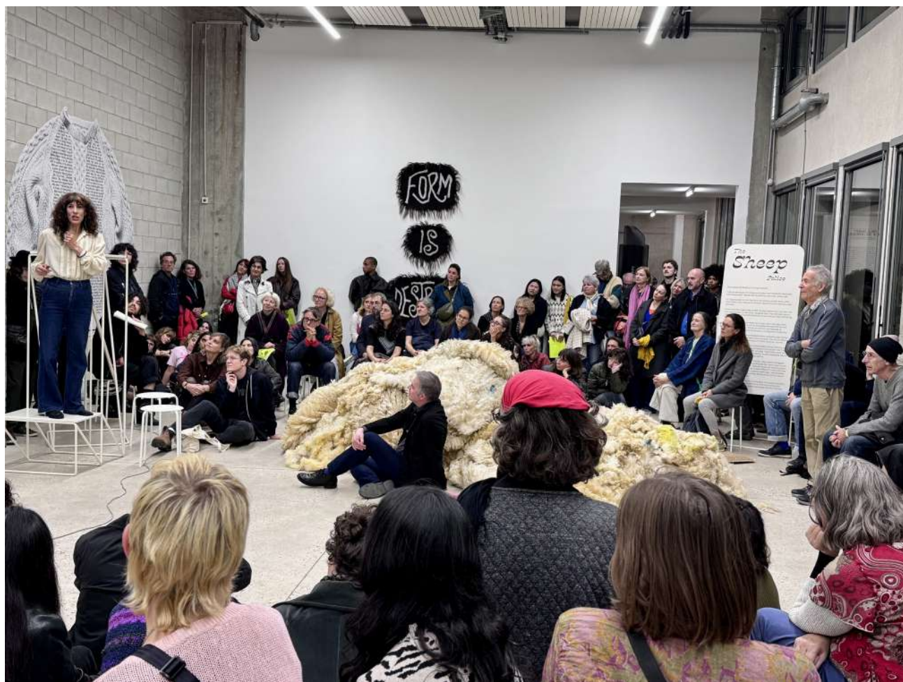
Vue de la performance « Spin Spin Schéhérazade » d'Orla Barry, Bétonsalon - centre d'art et de recherche, Paris, 2025. © Orla Barry / ADAGP, Paris 2025.