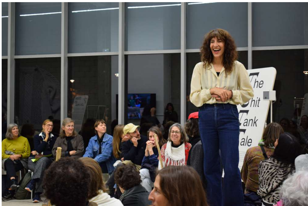
Vue de la performance « Spin Spin Schéhérazade » d'Orla Barry, Bétonsalon - centre d'art et de recherche, Paris, 2025. © Orla Barry / ADAGP, Paris 2025.