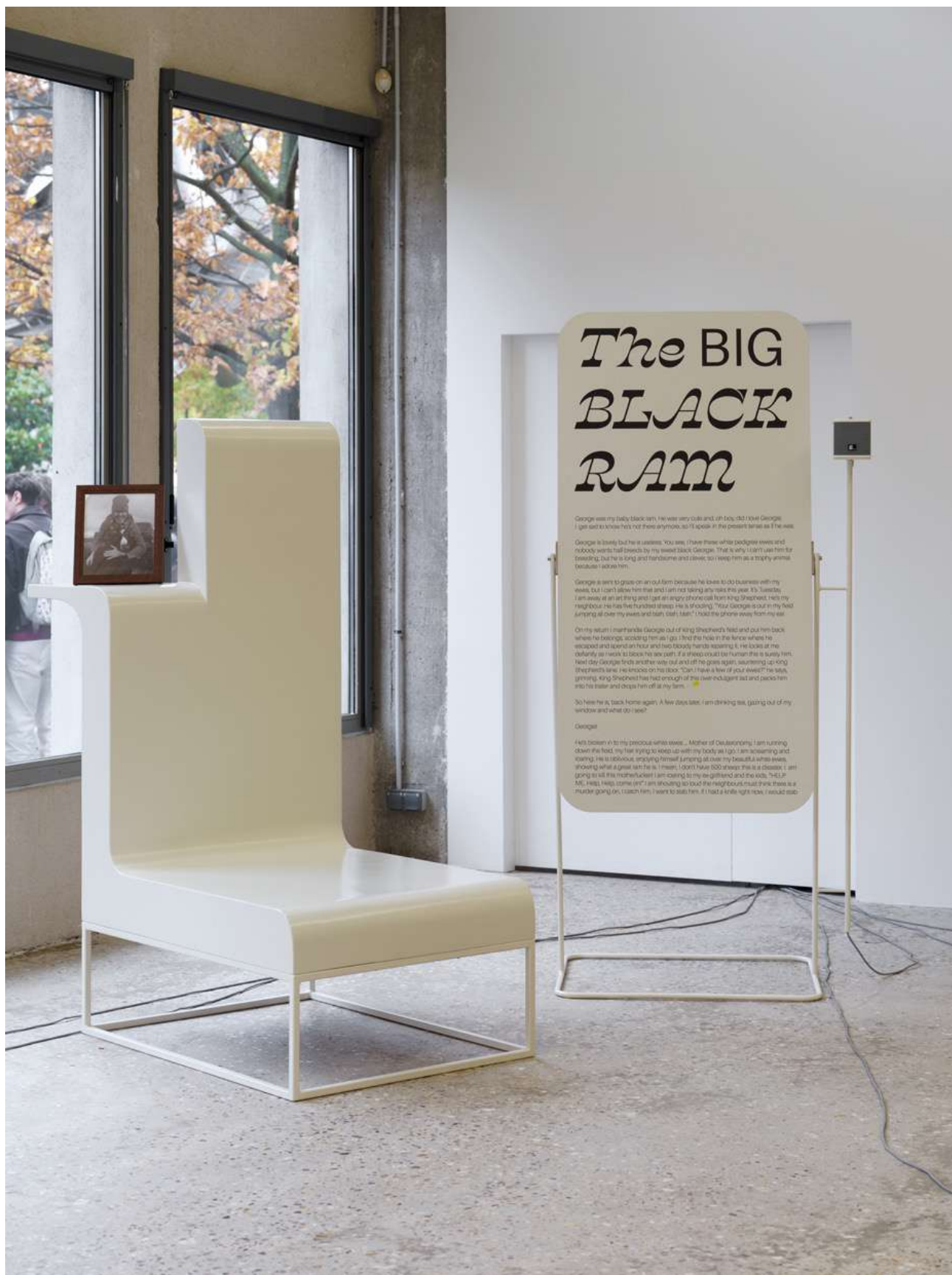
Spin Spin Scheherazade, 2019, installation sonore / performance, 65', matériaux divers, structures métalliques laquées, panneaux composites laqués, panneaux multiplex stratifiés, texte, forme en polyester, photographie encadrée, grille-pain, panier, sacs en jute imprimés, tabourets.

Vue de l'exposition « Cœur de Bergère » Orla Barry, Bétonsalon – centre d'art et de recherche, Paris, 2025. © Orla Barry / ADAGP, Paris 2025.