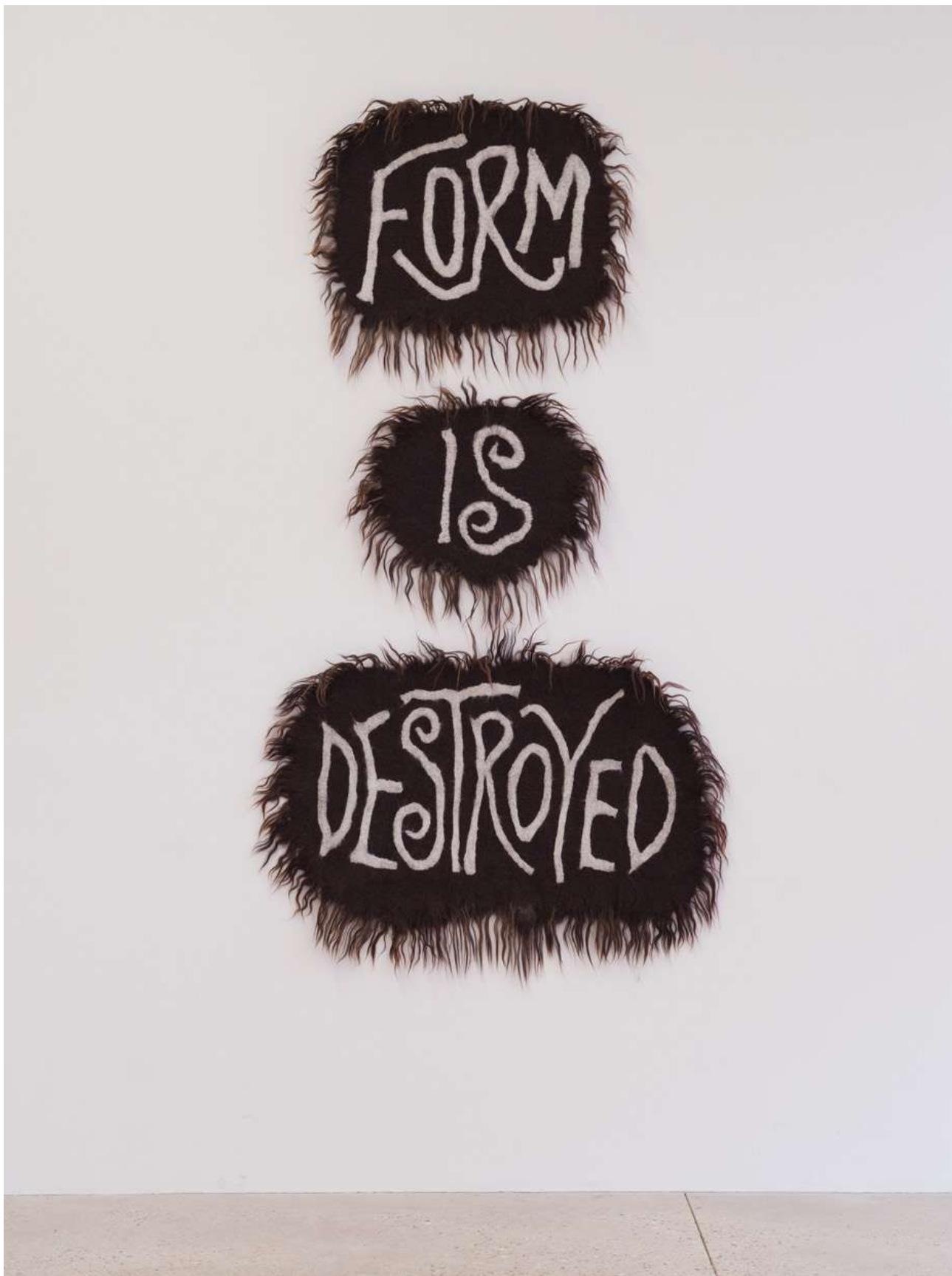
Form is Destroyed , 2023-2024, de la série « Shearling Felts », laine brute feutrée de moutons de Tiroler Bergschaf, Lleyn, Mérinos et Drenthe Heath.