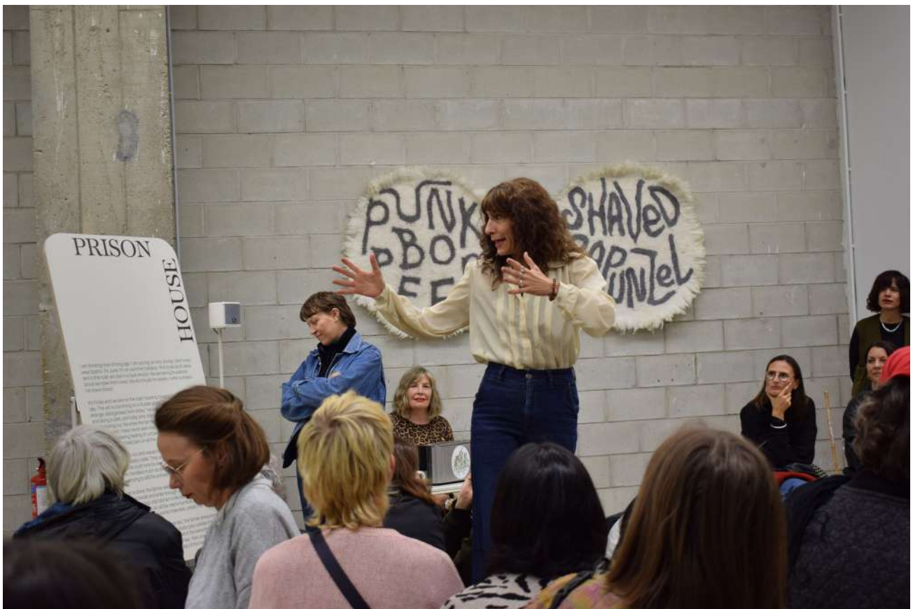
Vue de la performance « Spin Spin Schéhérazade » d'Orla Barry, Bétonsalon - centre d'art et de recherche, Paris, 2025. © Orla Barry / ADAGP, Paris 2025.