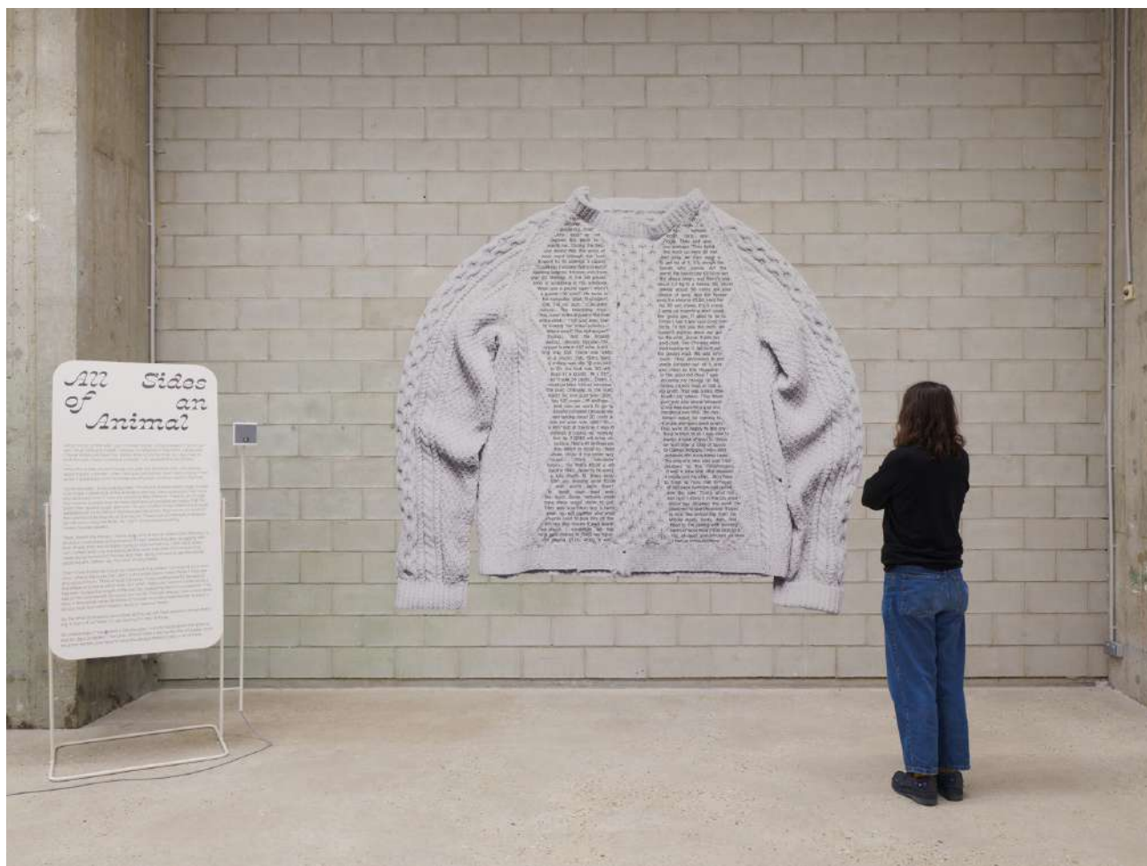
The Wool Merchant's Calculator & The Curator's Jumper, 2022, impression sur papier. Vue de l'exposition « Cœur de Bergère » Orla Barry, Bétonsalon – centre d'art et de recherche, Paris, 2025. © Orla Barry / ADAGP, Paris 2025.