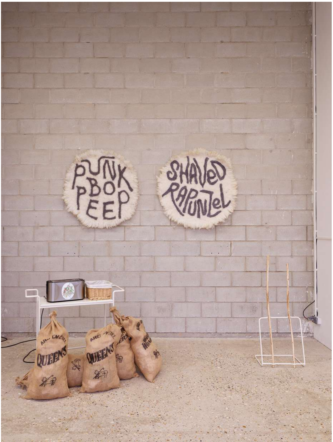
Vue de l'exposition « Cœur de Bergère » Orla Barry, Bétonsalon – centre d'art et de recherche, Paris, 2025. © Orla Barry / ADAGP, Paris 2025.