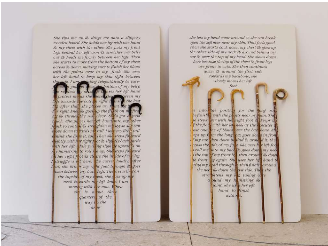
Shaved Rapunzel's Shepherds , 2019, houlettes de berger·ère peintes à la main, bois, corne de buffle, corne de béliet.

Vue de l'exposition « Cœur de Bergère » Orla Barry, Bétonsalon – centre d'art et de recherche, Paris, 2025. © Orla Barry / ADAGP, Paris 2025.